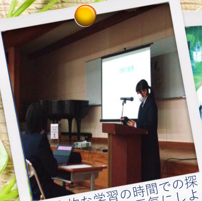
総合的な学習の時間での探求活動「栄村を元気にしよう」プロジェクト