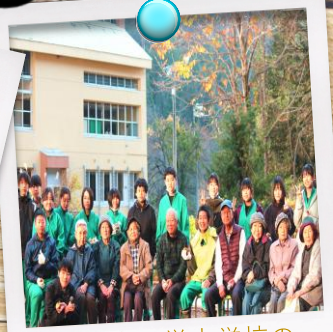
地域の方は栄中学校の応援団☆