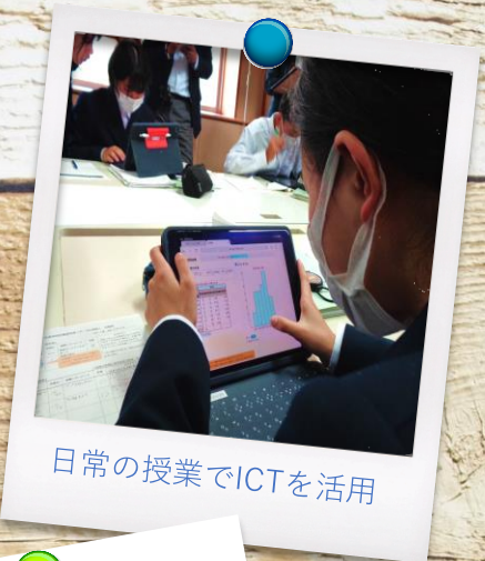
日常の授業でICTを活用