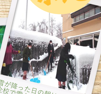
雪が降った日の朝は全校で雪かき！