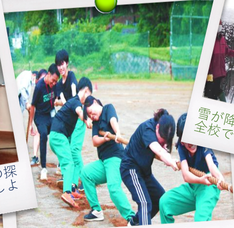
力を合わせて「オーエス」綱引き