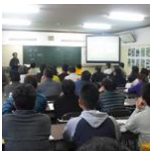
教室・講堂・体験室