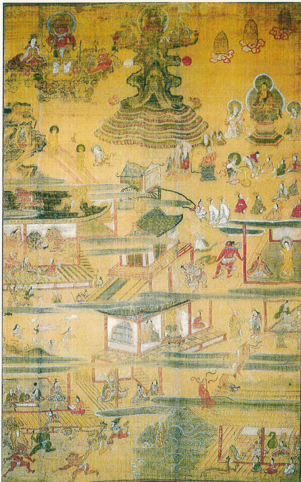
善光寺如来絵伝 第一幅