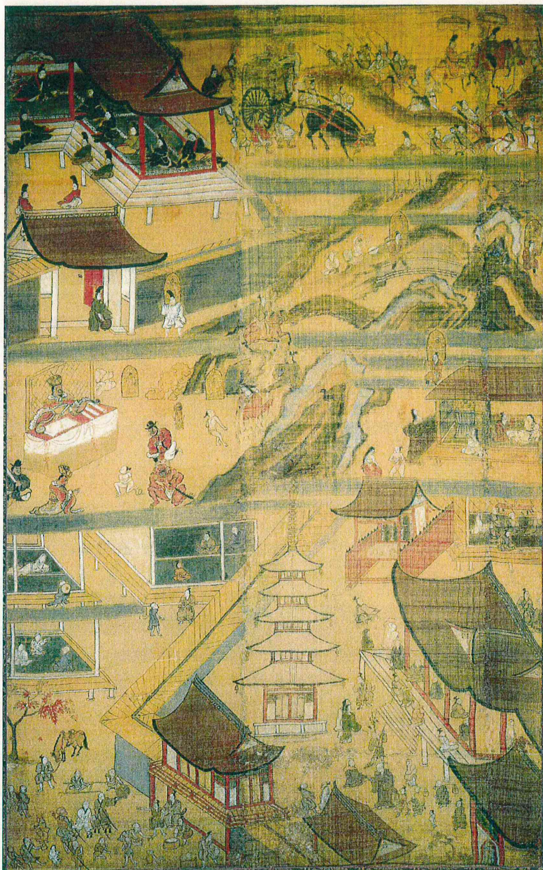
善光寺如来絵伝 第三幅