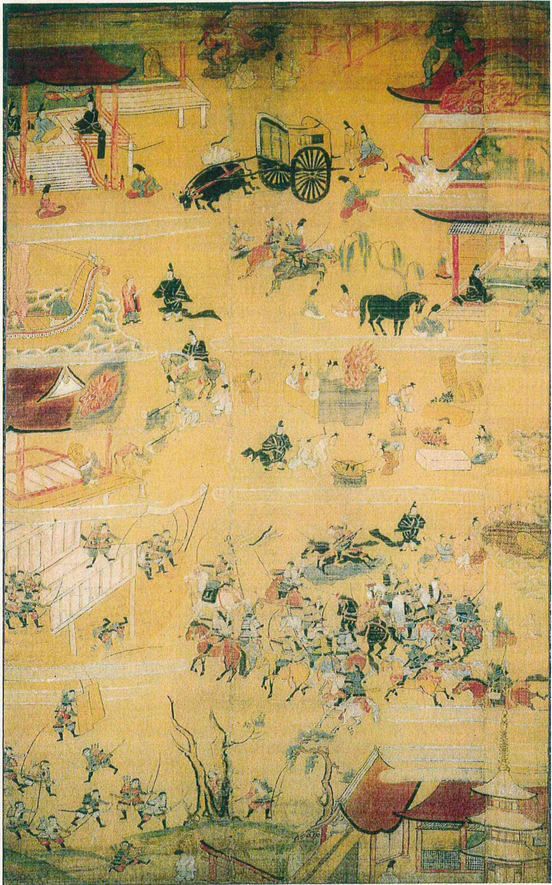
善光寺如来絵伝 第二幅