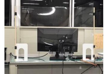
アクリル板をブック エンドに取付