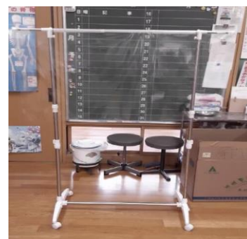
キャスター付きラックにビニールシートをつける