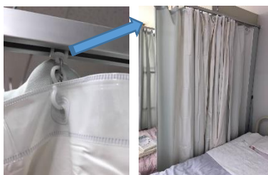
シャワーカーテンとカーテンを2重に取付け、使い分ける