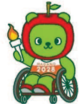
長野県国スポキャラクター「アルクマ」 ©長野県アルクマ