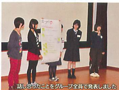
話し合ったことをグループ全員で発表しました

こうした課題について、平成27年9月、10月に県内の高校生が集まり「高校生ICTカンファレンス長野大会」が開かれました。