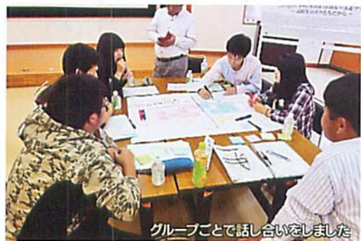
グループごとで話し合いをしました