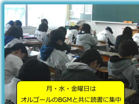
月・水・金曜日は オルゴールのBGMと共に読書に集中

11月からは「南高生としての自覚と誇りを持つてほしい」という学芸委員会からの提案により開始前に校歌が流れています。