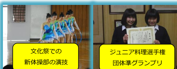
文化祭での 新体操部の演技

授業と課外活動にメリハリをつけ、学習の効率化をはかるために、月1回実施していた土曜授業を廃し、平成29年度より毎週火曜日と木曜日を7時限としています。