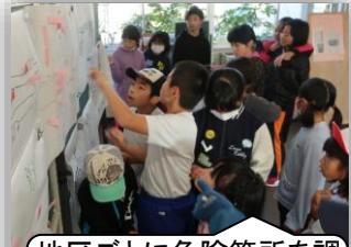
地区ごとに危険箇所を調べ「防災マップ」作り

富草小学校では、地元消防団や消防署の方々と連携した「防災ミニキャンプ」を昨年度スタートさせました。2回目となる30年度の様子を紹介します。「自分の命 自分で考え 自分で守る」防災を楽しく学ぶ富草小をテーマに、非通知避難訓練により行動のしかたを考えたり、4年生の総合的な学習の学びを全校に広げたりしたほか、地元の保育園児の参加や、保護者・地域の皆さんの参観を呼びかけたりするなど、防災の輪を広げることができました。子どもも大人もみんなで防災への意識を高め、町が大事にしている「考動力」を育むための行事として、今後も大事にしていきたいと考えています。