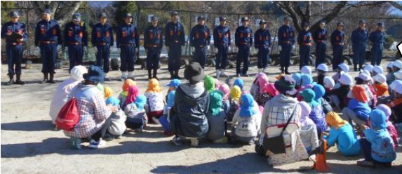
「防災ミニキャンプ」 に か け つ け て く れ た 地 元 消 防 団 員 や 消 防 署 の 皆 さ ん