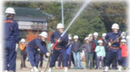
消防団員のきびきびとした 操法訓練を見学