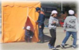
消防署員の協力で煙体験