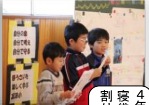
4年生の学習発表クイズや 寝袋作り等 防災について縦 割り班で楽しく学びました