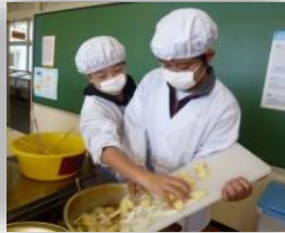
協力して飯ごう炊さんと カレー作りとてもお いしくできました