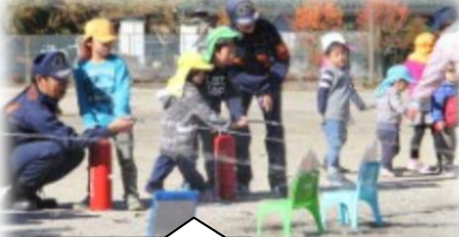
水消火器体験をする 園児たち