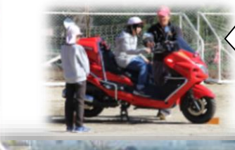
県内唯一の 消防用自動二輪