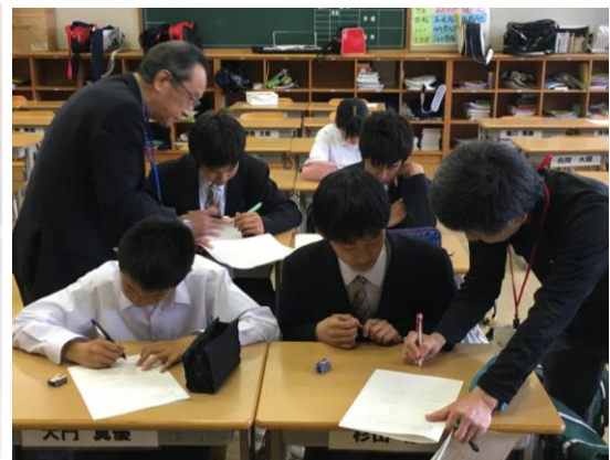
<前半と後半で自主学習と補充学習に分かれる>