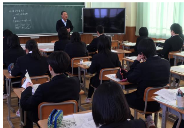
<町教委の担当者が一人一人に問題等を準備>