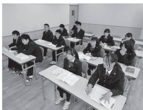
私立高校の授業風景