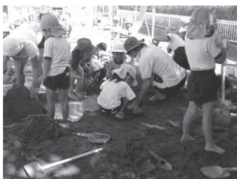
私立幼稚園の活動風景