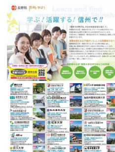
県外情報誌 新聞折り込み広告