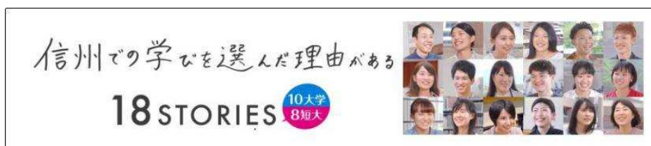
信州で学ぼう 動画 ランディングページ公開