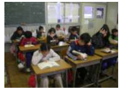
読書に集中する子ども達

本校の日課には清掃後の10分間毎日読書の時間が確保されています。子どもたちは清掃を終え教室に戻ると静かに自分の席に着き本を読み始めます。学校中が静寂に包まれます。全ての子どもたちが読書を通して自分と向き合っている時間です。この時間は子どもたちにも好評で、生活にめりはりと落ち着きを生み授業に向かう雰囲気や姿勢作りにも役立っています。