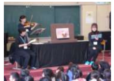
『ゆーゆーお話の会』の読み聞かせ

本校では保護者有志によって発足した読み聞かせサークル『ゆーゆーお話の会』による絵本の読み聞かせを年間を通じて朝の読書の時間（月・火）にやっています。読書旬間では全校を対象とした読み聞かせの会を開き、多人数で劇風に読んでくださり、バイオリンなどの楽器演奏とともに臨場感たっぷり、とても魅力的な舞台を演出して下さっています。子どもたちもゆーゆーの会の読み聞かせをとても楽しみにしています。