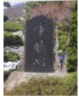
正面玄関前の唯聴心の石碑

埴生小学校は「唯聴心」＝「心をきくことのできる子ども」の育成を教育課題に掲げています。「心を聴く」姿勢は自分自身や相手との対話の積み重ねから生まれるものです。そのため自分と向き合える時間、すなわち自分自身の見方や考え方を深めてくれる読書の時間を充実させることが「唯聴心」を具現していく上で大きな手だてになると考えています。