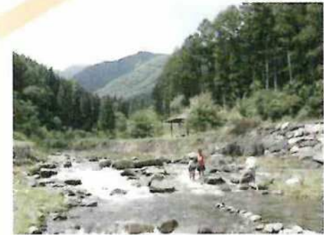
中俣せせらぎ公園