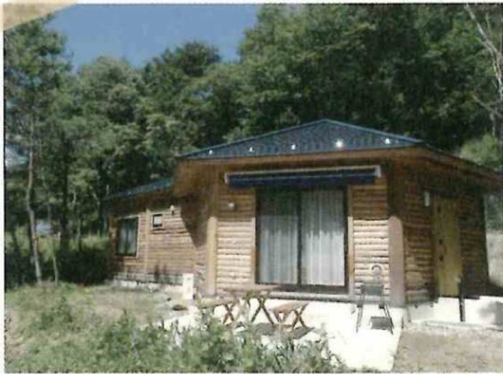
緑の体験館コテージ