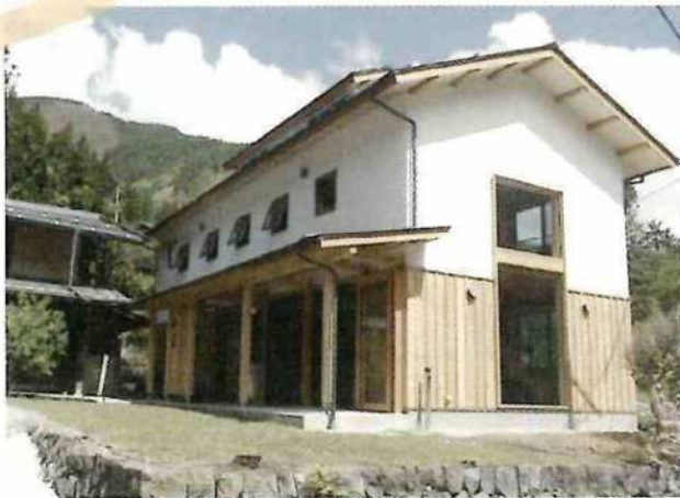
ゲストハウス かぜのわ