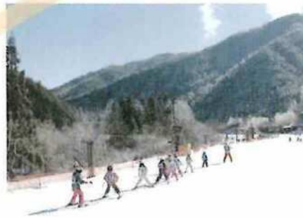
あさひプライムスキー場