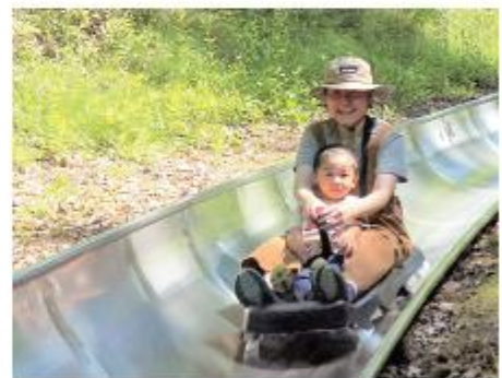
聖高原のスカイライダーは親子でお気に入りです!

また、麻績村は「コンバクトシティ」です。村の中にスーパー、コンビニ、ガソリンスタンド、郵便局、銀