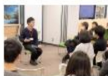
移住セミナーでの座談会

押しながらまわられてしまいます。またお酒やショッピングという子どもがいなかった頃の楽しみを時々取り戻すことができるのも、都市に住んでいてよかったなと思うところです。