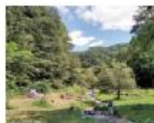
市街地から車で20分の川遊びスポット

一方で、都市ならではの便利さや楽しさも、暮らしを良いものにしてきています。特に、子育ては本場にしやすい環境だとよく夫婦で話をしています。乳幼児期にお世話になる施設として、乳幼児が健診を受ける保健センター、未就園児の親子が集まるつどいの広場、公園、食料や日用品をまとめて調達できる総合スーパーやショッピングモールがありますが、松本市は街がコンパクトなので、住むエリアによってはこれらの施設が徒歩圏内で、ベビーカーを