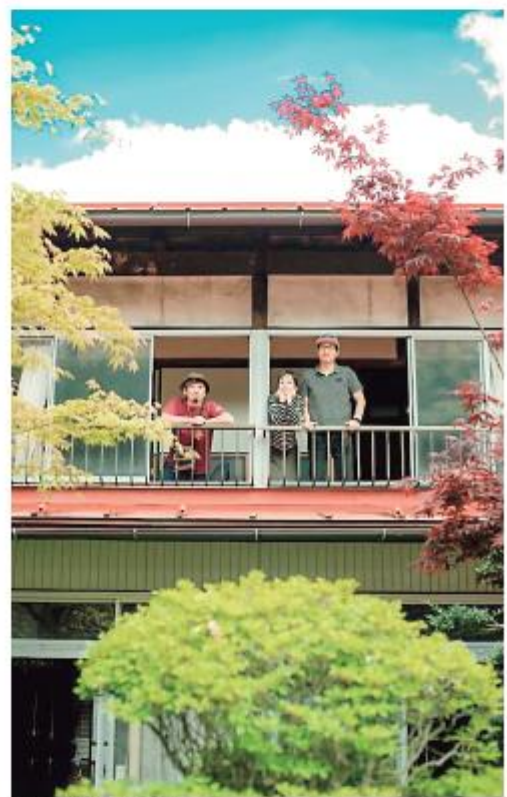
シェアハウス坂勤にて

の最初の居住地は、シェアハウス「信州塩尻中山道賢川宿場2000坂勤(通称・さかかん)」です。現在の生活が始まったのは、このシェアハウスのオーナーとの出会いから、と言ってもよいかもしれません。塩尻市へ通ううちに、シェアハウスで出会う人々だけでなく、地域のひと、そこに住むひとの魅力に気づき、「このひとたちと共になにかができたなら、きっと楽しいだろうな」という想いが沸き、塩尻を居住地として選びました。