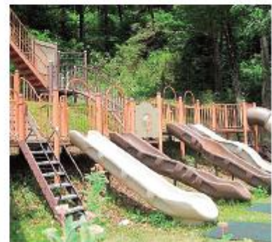
なろう原公園には、遊具もたくさん！

東京では、公園に行っても子どもが多すぎて思いっきり遊べないということがありましたが、山形村は車通りも少なく、眺めのいい公園もあるので、遊び放題です。また、騒音を気にしなくていいので、のびのびと暮らせます。