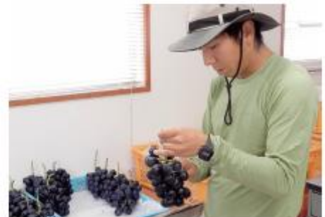
丹精込めて育てたぶどうは丁寧に扱い出荷されています

都会に暮らしていた方は、もしかしたら煩わしく思う方もいるのかもしれませんが、もともとここに住んでいる人たちは、人見知りせず初対面の自分にも気軽に声を掛けていただけで、地域に馴染むことができたと思います。田舎での生活は、対個人や決まった人だけではなく地域全体での活動や協働作業など関わりが多いので、それぞれの地域の習慣などを受け入れられることが大切だと思います。地域の方たちも、私たちのような移住者や会社に勤める若い人が多くなっていることを考えて、地域内の活動を少しずつ変えていただいています。とてもありがたいことで、そうしたこともあってこの環境に慣れました。今では、私の生活の中ではそれが当たり前となっています。