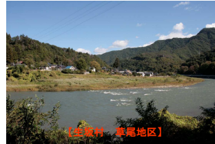
(宝塚村・草尾地区)