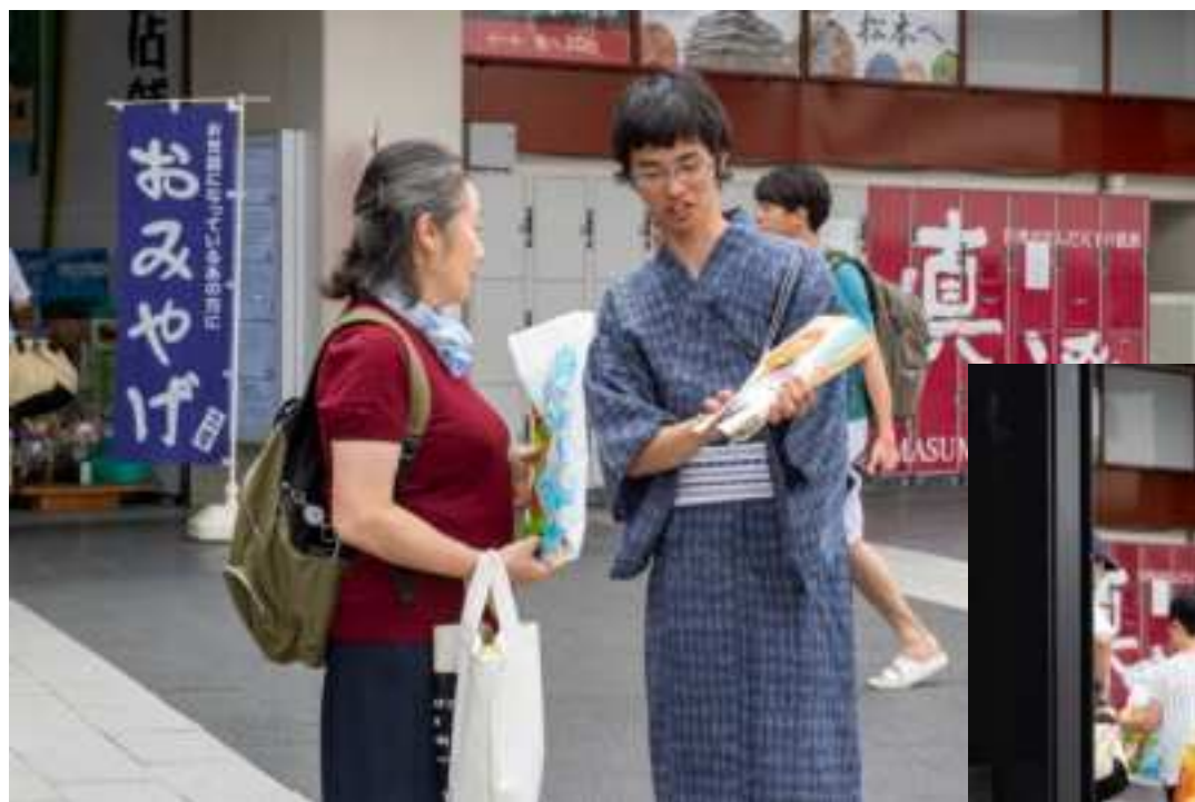
エクセラン高校生がゆかた 姿で配布