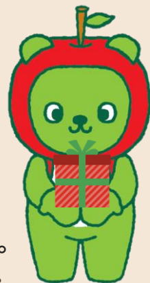
長野県PRキャラクター 「アルクマ」 ©長野県アルクマ

全国で発生する食品ロスは年間約472万トンと推計され（農林水産省調査）、1人1日当たりでは、おにぎり約1個分の食品を捨てていることとなります。食料は大切な資源です。貴重な食品をロスにしないために、フードドライブへの寄贈にご協力をお願いします。