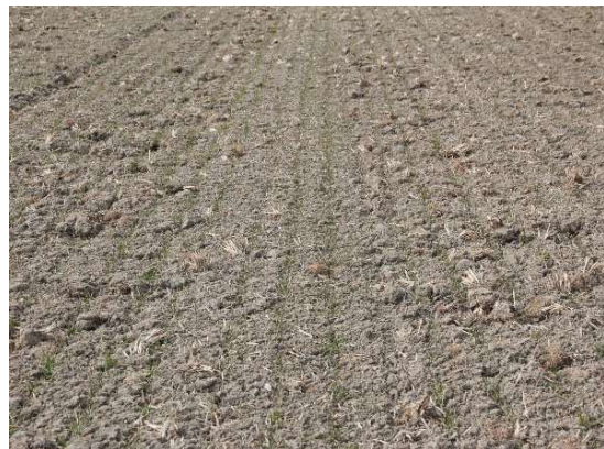
茎数300本/ m^2 未満