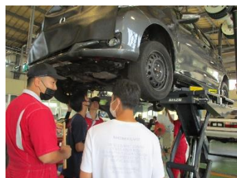
自動車整備科(2年制)

エアコン工事で使用する配管の加工と接続を行い、配管に漏れがない事を試験して冷凍空調設備工事を体験できます。