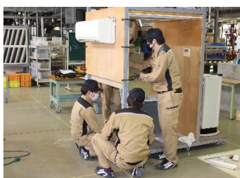
冷凍空調設備科(1年制)

電線を配線してスイッチやコンセント等の器具へ接続を行い、電気を流して照明器具を点灯させる電気工事を体験できます。