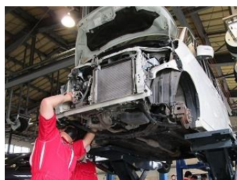
自動車整備科(2年制)

エアコン工事で使用する配管の加工と接続を行い、配管に漏れがない事を試験して冷凍空調設備工事を体験できます。