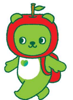
長野県PRキャラクター「アルクマ」