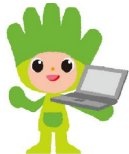
長野県ものづくり人材育成応援 キャラクター わざまる