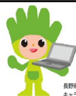
長野県ものづくり人材育成応援キャラクター わざまる