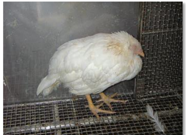
高病原性鳥インフルエンザウイルスに感染し、元気をなくしている鶏