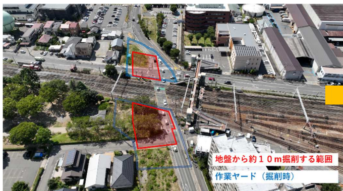
宮田前踏切 立体化工事箇所