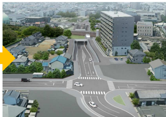
【完成予想図】東側から線路を見る