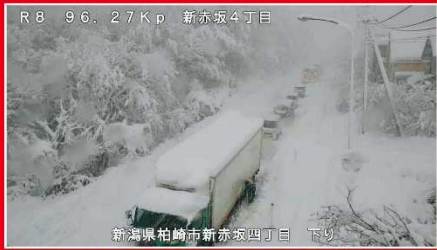
令和4年12月19日 国道8号(登坂不能車による交通障害の発生状況)