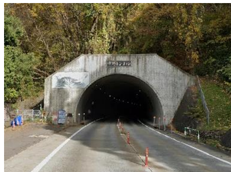
中野トンネル(中野市)