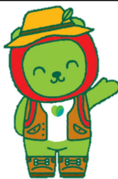
長野県PRキャラクター「アルクマ」 (信州DCバージョン) ©長野県アルクマ

*2 ：地図カテゴリ選択「生活」→マップ選択「H27 交通量調査」から確認(別紙3頁参照)