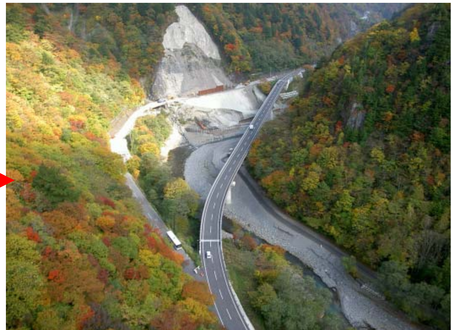
整備後 H22.3.26 完成供用