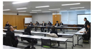
[信州みちビジョン検討委員会の様子]

閲覧方法 「信州みちビジョン」の全編及び概要版等は、下記 URL からご覧いただけます。 https://www.pref.nagano.lg.jp/michiken/infra/doro/vision/index.html