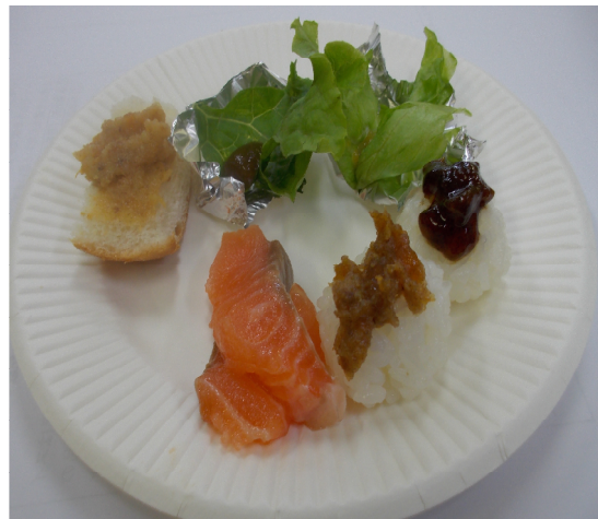
「魅力ある高森町らしいメニューと商品の開発委員会」で検討した試作品