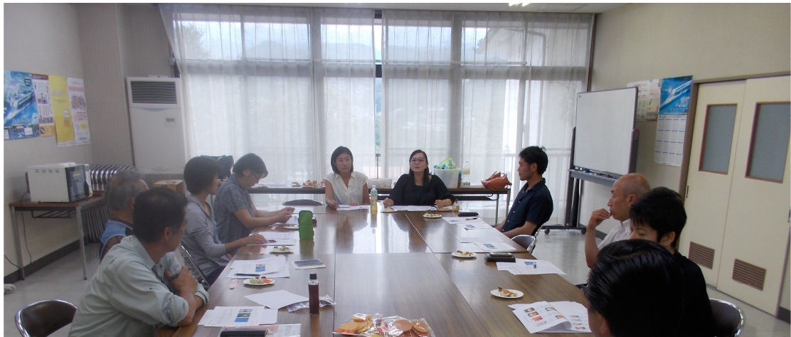
「魅力ある高森町らしいメニューと商品の開発委員会」の様子