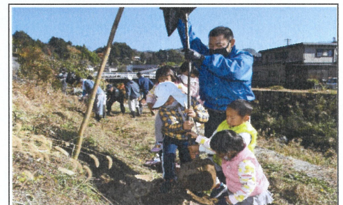
【遊歩道周辺の河岸に植樹】

④一級河川である米川を活用出来た事はとても嬉しく思っており、 植樹した河津桜は令和4年の春には若干花をつける枝もあるよう で一年目から大変期待している。