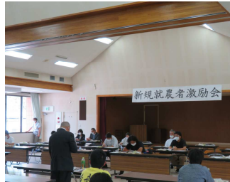
先輩農業者の体験談