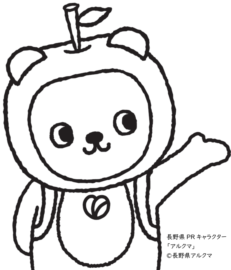
長野県 PR キャラクター 「アルクマ」