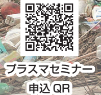
プラスセミナー 申込QR

令和6年1月26日(金)までに、三次元バーコード (URL)、裏面の参加申込書 (FAX)、メールのいずれかにてお申し込みください。