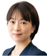
農林水産省 大臣官房審議官（技術・環境） 西経子氏（元和食堂長）