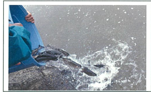
【ニジマス放流の様子】