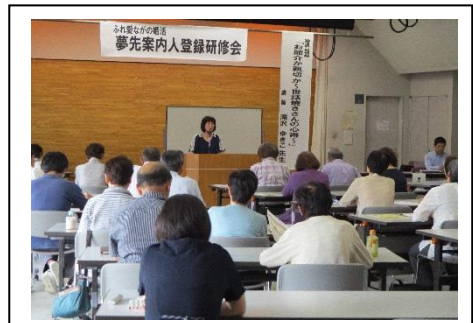
【夢先案内人研修会】