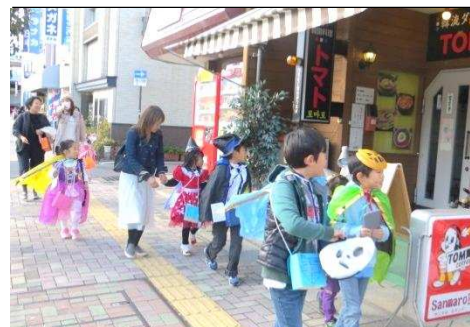
【ハロウィン！フェスタ：商店街を仮装して歩く子どもたち】