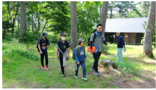
令和5年7月26日、長野市戸隠一の鳥居苑地で、長野地区みどりの少年団交流集会被開催されました。長野地区での開催は4年ぶり、101名が参加してくれました。