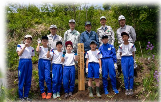
みどりの少年団、主催者、来賓と記念標柱