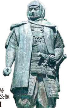
春日山城跡 上杉謙信公像 MAP A-4

2018年6月にオープンした水族博物館「うみがたり」をはじめ、恋する灯台のある「弁天岩」や「シーサイドパーク名立」など名所がひしめく日本海エリア。上杉謙信公の居城「春日山城跡」、桜と蓮の名所「高田城址公園」も必見です。 [問] 上越市立水族博物館 うみがたり ☎025-543-2449 親不知 ☎025-555-7344(糸魚川市観光協会) シーサイドパーク名立 ☎025-526-5111(上越市施設経営管理室) 春日山城跡 ☎025-545-9269(上越市文化行政課) 高田城址公園 ☎025-543-2777(上越観光コンベンション協会) 道の駅マリンドリーム能生 ☎025-566-3456