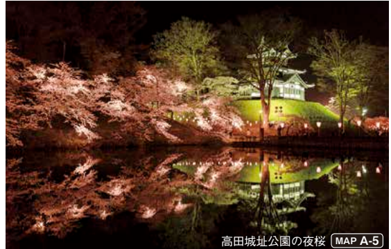
高田城址公園の夜桜 MAP A-5