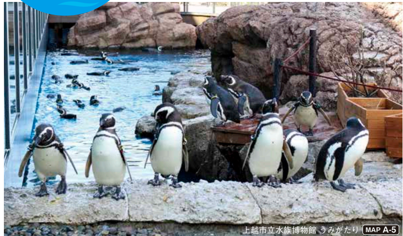
上越市立水族博物館 うみがたり MAP A-5