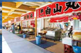
弁天岩、道の駅マリンドリーム能生(カニや横丁) MAP A-3