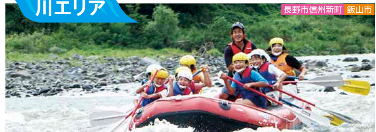
長野市信州新町 飯山市