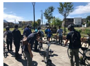
R5. 9. 25 開催の長野・北信サイクルツーリズム推進会議の様子