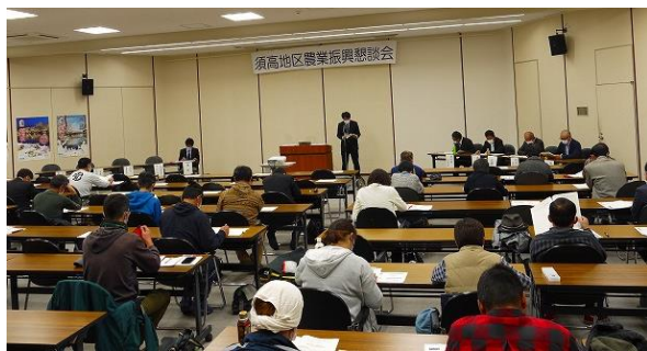
農業農村支援センターの担当者による生育状況説明