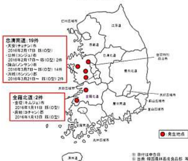
韓国における口蹄疫の発生状況 (2016年1月以降)