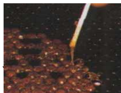
アメリカ腐蛆病:糸を引く蜂児