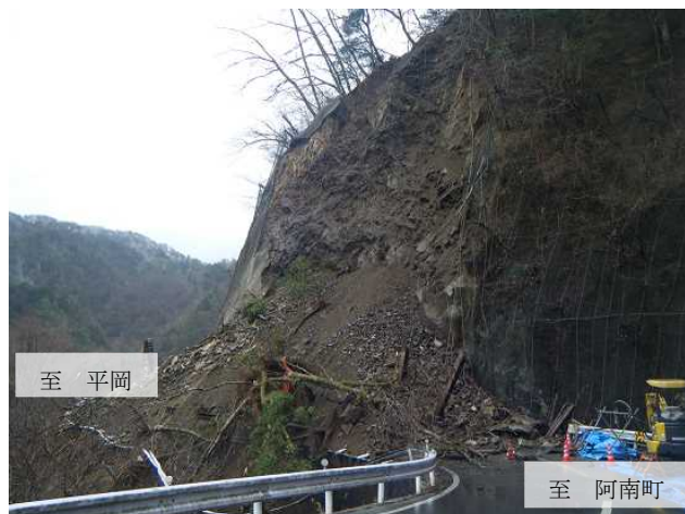
道路を塞いだ土砂の状況 (3 月 21 日)