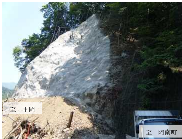
現在の工事状況 (5 月 30 日)