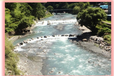
遠山中学校工区 完成