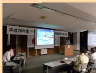
中部地方整備局 管内事業発表会 事例発表 (優秀賞を獲得)