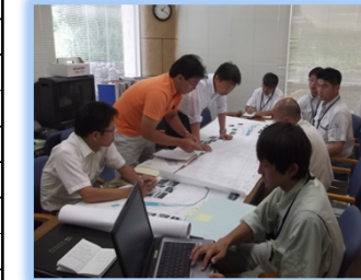
自然共生センターへ技術相談