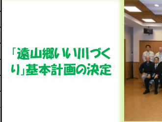
「遠山郷いい川づくり」基本計画の決定