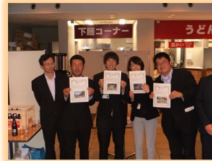
「関東のいい川づくり選定委員会」事例発表 (総合順位2位を獲得)