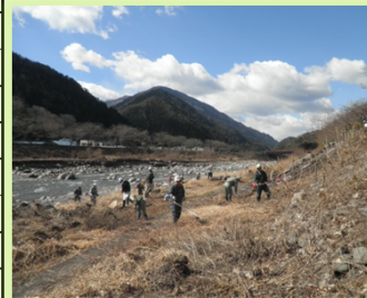
「遠山郷いい川づくり」推進会議