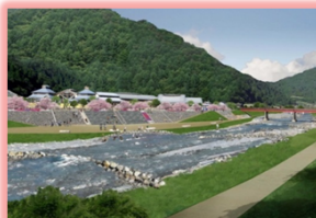
道の駅「遠山郷」周辺 完成イメージ