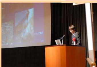
天竜川シンポジウム 事例発表