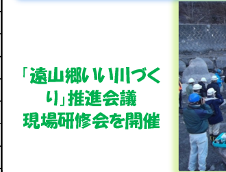
「遠山郷いい川づくり」推進会議 現場研修会を開催