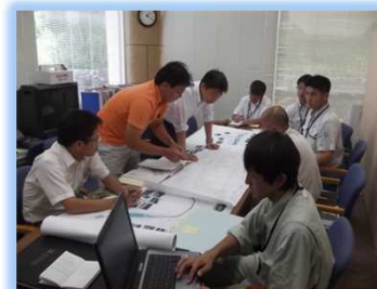
自然共生センターへ 技術相談