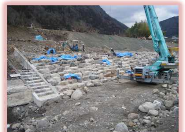
かぐら大橋上 右岸工事(施工中)