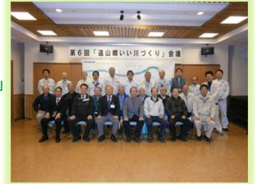
「遠山郷いい川づくり」 基本計画の決定