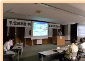
中部地方整備局 管内事業発表会 事例発表 (優秀賞を獲得)