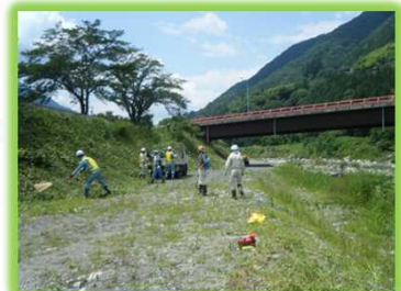
「遠山郷いい川づくり」 推進会議 河川愛護活動を実施