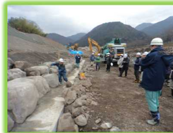
「遠山郷いい川づくり」 推進会議 現地見学会を開催