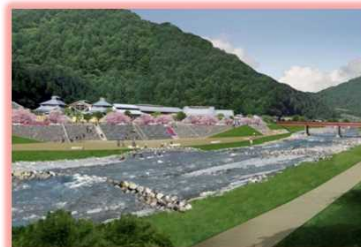
道の駅「遠山郷」周辺 完成イメージ