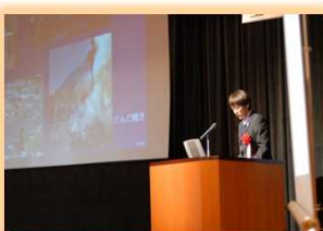
天竜川シンポジウム 事例発表