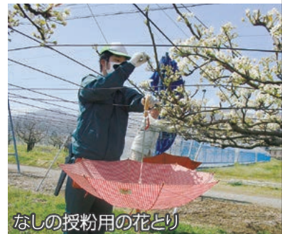
なしの授粉用の花どり