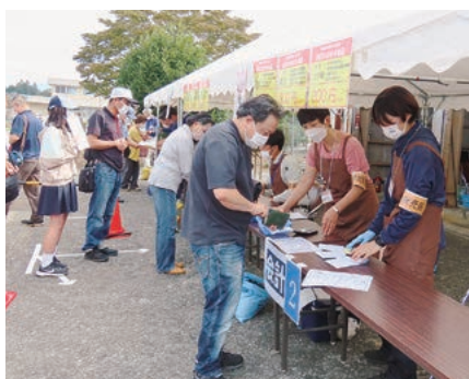
試験場一般公開(生産物販売)