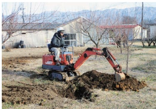
バックホーの操作練習(農業機械実習)