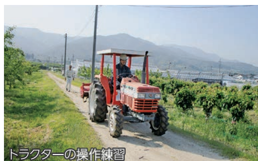
トラクターの操作練習