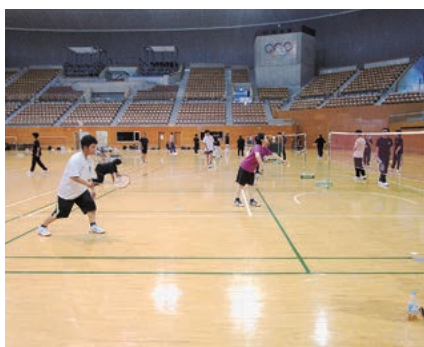
長野県農業大学校全学体育大会