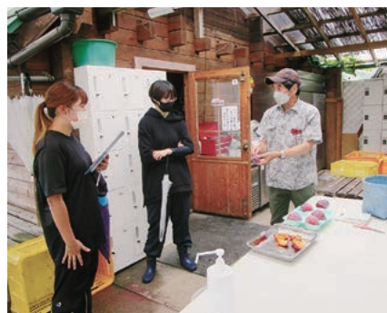
すもも品種の試食