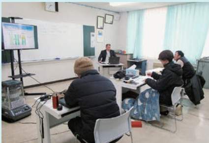
外部講師による講義