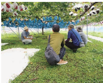
山梨県果樹試験場