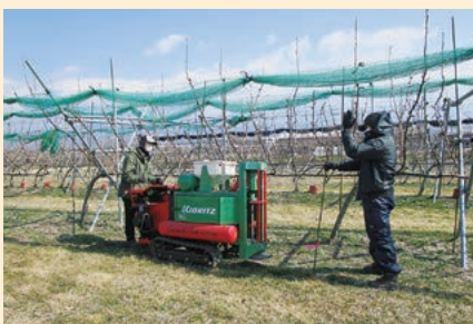
グロースガン(土壌に圧縮空気を打ち込む機械)による土壌改良