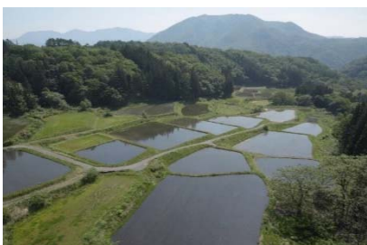
棚田の全景(坪山地区)

本村は全域が中山間地域となっているため、一つの地域に限定せずに、村全域で取り組んでいる。棚田の維持管理だけでなく、法面や水路の維持管理も併せて行っているため、農業活動が全て棚田保全につながっている。