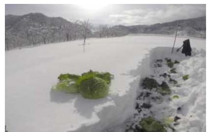
雪中キャベツの様子