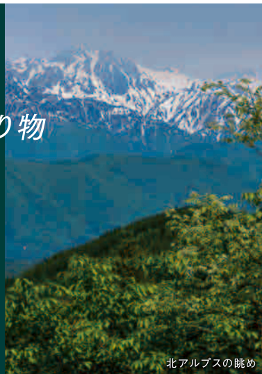
北アルプスの眺め

安曇野IC=池田町・あづみ野池田クラフト パーク(ぶどう畑)★=道の駅池田(池田町 ハーブセンター)(買物)=上原用水(水遊 び・散策)=越荒沢堰★=木流川★ =安曇野IC・長野IC ★スケッチポイント